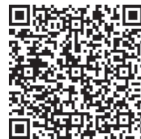
Baby- und Kleinkinderschwimmen