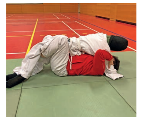
Selbstverteidigung in der Bodenlage

Ju-Jitsu ist ein Kontaktsport, d.h. um unsere Selbstverteidigung zu trainieren, benötigen wir einen Partner, der uns auf verschiedene Art und Weise angreift. Doch zu Corona-Zeiten ist uns dieser Nahkontakt nicht angenehm. Abhilfe musste her! So wurden aus Decken, Kissen, Papprollen, Schwimnudeln und vielem mehr Dummies gebastelt. Unsere lieben Partner greifen uns nicht an, aber trotzdem können wir verschiedene Techniken an ihnen üben, wie z. B. Festhaltetechniken in Bodenlage und andere Techniken. Der große Vorteil unserer Dummies ist: sie beschweren sich nicht über zu harte Verteidigung, schwatzen nicht und können nach dem Training in den Schrank gesperrt werden!