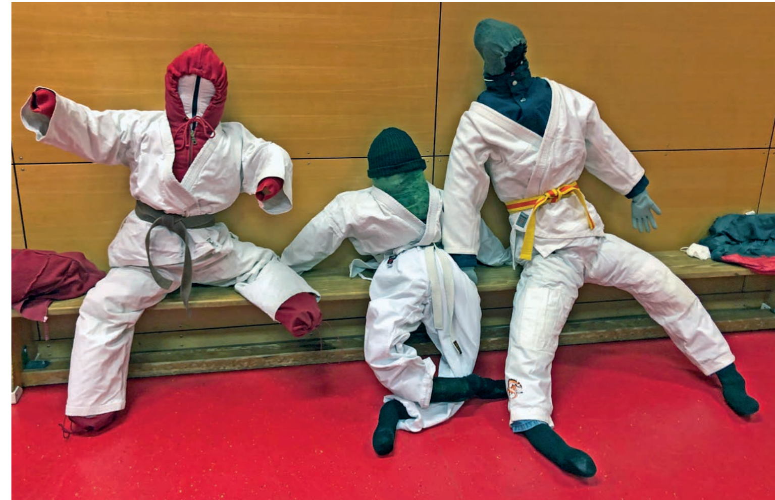
Nach dem Training hängen die „neuen Mitglieder“ etwas in den Seilen.