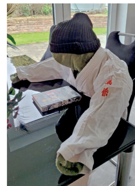
Auch theoretisch bereiten sich die Dummies intensiv auf das Training vor.

Ju-Jitsu ist ein Kontaktsport, d.h. um unsere Selbstverteidigung zu trainieren, benötigen wir einen Partner, der uns auf verschiedene Art und Weise angreift. Doch zu Corona-Zeiten ist uns dieser Nahkontakt nicht angenehm. Abhilfe musste her! So wurden aus Decken, Kissen, Papprollen, Schwimnudeln und vielem mehr Dummies gebastelt. Unsere lieben Partner greifen uns nicht an, aber trotzdem können wir verschiedene Techniken an ihnen üben, wie z. B. Festhaltetechniken in Bodenlage und andere Techniken. Der große Vorteil unserer Dummies ist: sie beschweren sich nicht über zu harte Verteidigung, schwatzen nicht und können nach dem Training in den Schrank gesperrt werden!