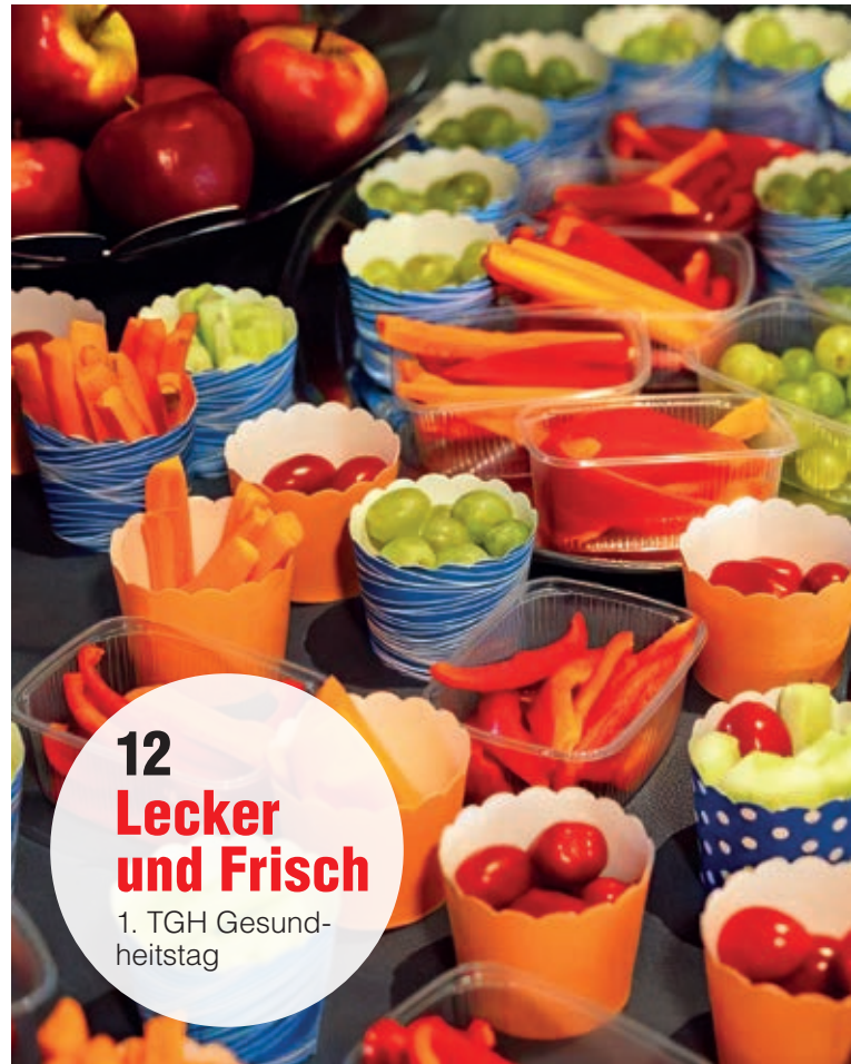
12 Lecker und Frisch 1. TGH Gesundheitstag