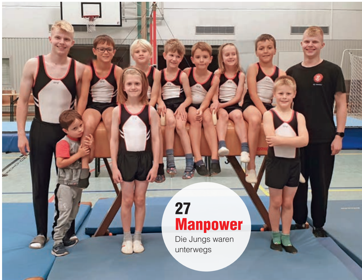
27 Manpower Die Jungs waren unterwegs