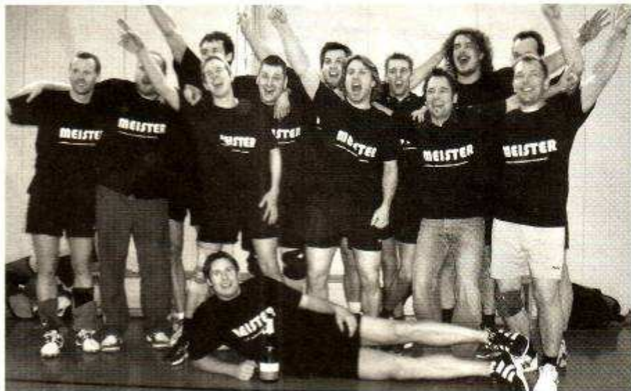
In Siegerlaune: Die Volleyballer der TG Hanau haben nach dem Aufstieg in die Oberliga allen Grund zum Jubeln.